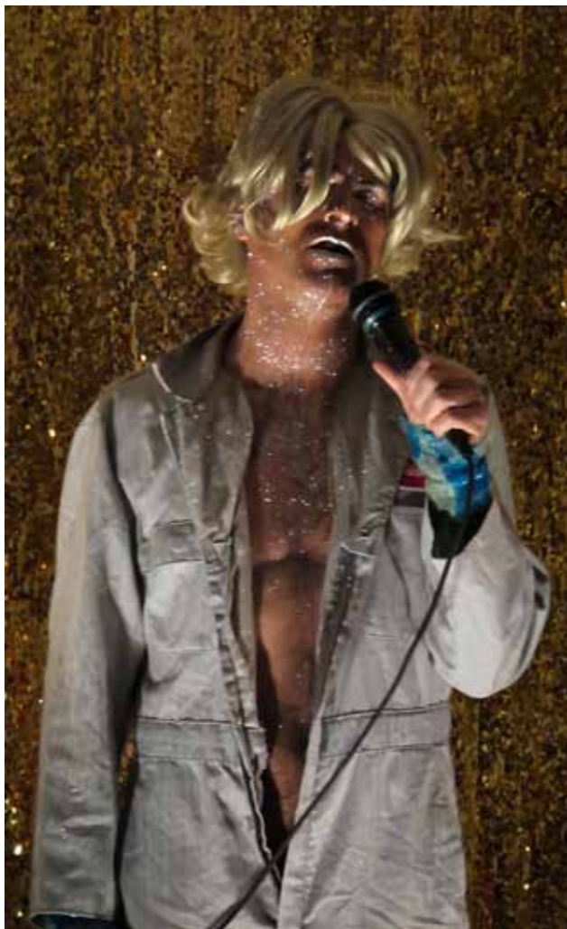
KUVA | PHOTO MONA CARON